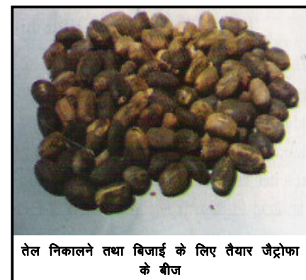
तेल निकालने तथा बिजाई के लिए तैयार जेट्रोफा के बीज

सकता है परन्तु विशेषतया राजस्थान में तो इसे बड़े पैमाने पर खेतों में भी लगाया जा सकता है क्योंकि वहां बंजर भूमि भी उपलब्ध है (जो सामान्यतया अनउपजाऊ भी है तथा सस्ती भी)।