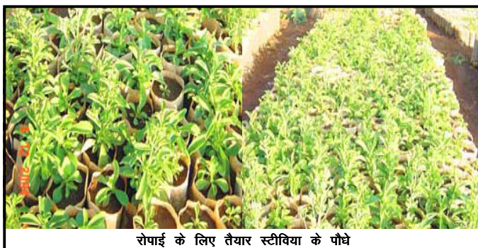
रोपाई के लिए तैयार स्टीविया के पौधे

स्टीविया की उपयोगिता इसमें पाये जाने वाले मिठास तथा औषधीय गुण के कारण हैं। इन्हीं गुणों के कारण इसकी आर्थिकी भी उच्चतम है, इसकी पत्तियों में सामान्य चीनी से 30 गुना अधिक मिठास होती है। इसके अतिरिक्त यह कैलोरी रहित होता है। इन्हीं दो गुणों के कारण यह मधुमेह रोगियों के लिये रामबाण औषधि है। भारतीय परिवेश एवं जीवनशैली तथा खान-पान मिष्ठान के अभाव में अधूरा ही माना जाता है। यही कारण है कि इस देश में मधुमेह हाइपरटेन्सन एवं मोटापे के शिकार लोगों की संख्या