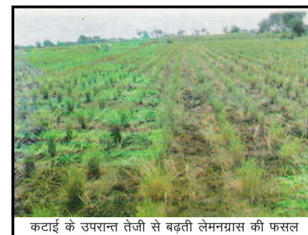
कटाई के उपरान्त तेजी से बढ़ती लेमनग्रास की फसल

इसके लिए मिट्टी पलटने वाले हल से या हैरो से आड़ा-तिरछा (क्रास) जुताई करनी चाहिए। मिट्टी को दीमक आदि के प्रकोप से मुक्त रखने की दृष्टि से यह आवश्यक है कि आखिरी