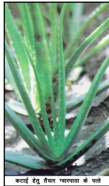
कटाई हेतु तैयार ग्वारपाठा के पत्ते

अल्टरनेरिया अल्टरनाटा तथा फ्यूजेरियम सोलानी के प्रभाव से ग्वारपाठा में लीफ-स्पॉट बीमारी हो सकती है। इससे जहां पौधे की बढ़वार प्रभावित होती है वहीं इससे पौधों में तैयार होने वाली जेल की गंध भी प्रभावित होती है इससे सुरक्षा हेतु मैकोजेब अथवा क्लोरोथेनोनिल की तीन ग्राम मात्रा को एक लीटर पानी में घोल करके स्प्रे किया जाना चाहिए। इनसे सुरक्षा हेतु जैविक विधियां भी प्रयुक्त की जा सकती हैं।