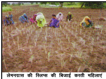
लेमनग्रास की स्लिप्स की बिजाई करती महिलाएं

उपरोक्तानुसार देखा जा सकता है कि लेमनग्रास एक बहुउपयोगी घास है जो न केवल सुगंधीय दृष्टि से बल्कि औषधीय दृष्टि से भी काफी उपयोगी है। भारतीय लेमनग्रास के पत्तों तथा इसके तेल की विदेशों में मांग बढ़ने के फलस्वरूप इसकी बड़े स्तर पर खेती की सफलता की संभावनाएं और भी जयादा बढ़ गई हैं तथा किसानों में इसकी खेती के प्रति रुचि बढ़ती जा रही है। इसकी उपयोगिता तथा बढ़ते जा रहे बाजार को देखते हुए इसकी खेती को बड़े स्तर पर अपनाया जाना समय की मांग है।