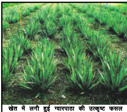
खेत में लगी हुई ग्वारपाठा की उत्कृष्ट फसल

उपयुक्त होती है। इस फसल को तुषार अथवा पाले से बचाए रखने की आवश्यकता होती है। वैसे सामान्यतया इस फसल के लिए गर्म तथा शुष्क जलवायु ज्यादा उपयुक्त रहती है।