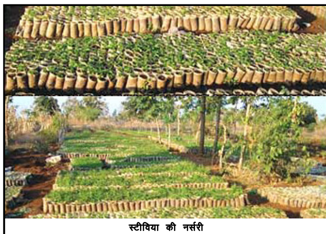
स्टीविया की नर्सरी

उन क्षेत्रों को छोड़कर जहां का न्यूनतम तापक्रम 5°C से नीचे शीत ऋतु में चला जाता है, स्टीविया लगभग सभी क्षेत्रों में उगाया जा सकता है। ग्रीष्म ऋतु में होने वाला उच्च तापमान 43 अंश से उपर इस पौधे पर प्रभाव डाल सकता है तथा पौधे की वृद्धि रुक जाती है परन्तु यदि पहले से ही व्यवस्था कर ली जाए तथा स्टीविया की वही प्रजाति लगाई जाए तो उच्च तापक्रम में सफलतापूर्वक चल सके तथा पौधों को तेज गर्मी से बचाने के लिए इसका रोपण जैट्रोफा आदि के पौधों के बीच में किया जाए तो ज्यादा तापक्रम का प्रभाव नहीं होगा। कई किसान इस प्रकार का तापमान बनाये रखने की दृष्टि से पालीहाउस अथवा ग्रीन हाउस, नेट हाउस का उपयोग भी करते हैं। ज्यादा छाया होने से