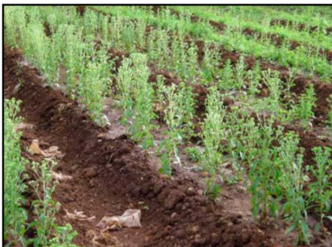
खेत में तैयार होते स्टीविया के पौध