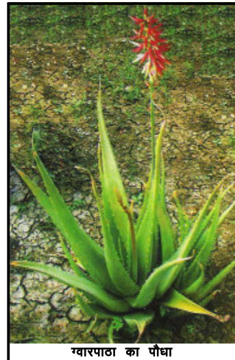
ग्वारपाठा का पौधा

ग्वारपाठा की उत्पत्ति पूर्वी तथा दक्षिणी अफ्रीका, फनारी द्वीप समूह तथा स्पेन में होना मानी गई है। कि वेस्ट इंडीज़, भारत तथा चीन में यह सोलहवीं शताब्दी में पहुंचा। अत्यधिक आसानी से पनपने वाला यह पौधा यूं तो प्राकृतिक अवस्था (जंगली अवस्था) में भी काफी स्थानों पर (विशेषतया