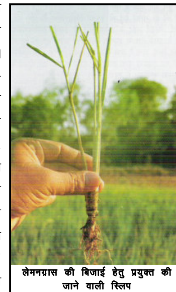
लेमनग्रास की बिजाई हेतु प्रयुक्त की जाने वाली स्लिप

नींबू घास की दूसरी मुख्य किस्म — सिम्बोपोगान सिट्रस का प्राप्ति स्थल दक्षिणी पूर्वी एशियाई देश है। वर्तमान में इसकी खेती मुख्यतया मेडागास्कर, कैमरून दीप समूहों, ब्राजील, चीन तथा इण्डोनेशिया में की जा रही है। इनके साथ-साथ लेमनग्रास की एक अन्य प्रजाति सिम्बोपोगान पैण्डुलस है जिसे "जम्मू लेमनग्रास" भी कहा जाता है। इस प्रजाति का उपयोग भी लेमनग्रास तेल की प्राप्ति हेतु किया जाता है हालाँकि काफी कम मात्रा में।