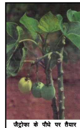
जैट्रोफा के पौधे पर तैयार

जहां तक जैट्रोफा के तेल का डीज़ल के विकल्प के रूप में उपयोग