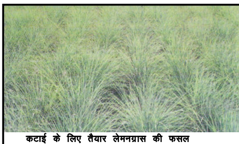
कटाई के लिए तैयार लेमनग्रास की फसल

लेमनग्रास अथवा नीबू घास भारतवर्ष के विभिन्न भागों में उत्पन्न होने वाली वह प्रमुख घास है जिसका उपयोग संगंध उद्योग में भी होता है तथा औषधीय कार्य हेतु भी। इसके साथ-साथ इसे विभिन्न खाद्य पदार्थों के उत्पादन में भी उतनी ही बखूबी प्रयुक्त किया जाता है जितना पेय पदार्थों के उत्पादन में। इतने अधिक विविध उपयोगों में प्रयुक्त होने के कारण देश के विभिन्न भागों के किसान इसकी खेती को काफी बड़ी मात्रा में अपनाते लगे हैं तथा जिस गति से इसका देशीय तथा अंतर्राष्ट्रीय बाजार बढ़ रहा है उससे यह सहज ही अंदाजा लगाया जा सकता है कि आने वाले कुछ ही वर्षों में लेमनग्रास की फसल औषधीय एवं सुगंधीय पौधों के कृषिकरण से जुड़े किसानों की सर्वाधिक चहेती फसल के रूप में उभरेगी।