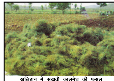
खलिहान में सूखती कालमेघ की फसल

यदि किसान पौधों से बीज भी प्राप्त करना चाहें तो इसे अक्टूबर माह में उखाड़ने की बजाए एक-दो महीने और खेत में लगा रहने दिया जाता है तथा जनवरी-फरवरी माह में जब काफी मात्रा में फलियां पक जाएं तो सम्पूर्ण पौधे को उखाड़ लिया जाता है। इस स्थिति में उखाड़ने पर पत्ते तो अपेक्षाकृत कम हो जाते हैं परन्तु बीज की अतिरिक्त प्राप्ति किसान को हो जाती है। एक बात ध्यान देने वाली यह भी है कि यदि पत्तों की मात्रा कम भी रहे तब भी फसल के काफी अच्छे दाम मिल