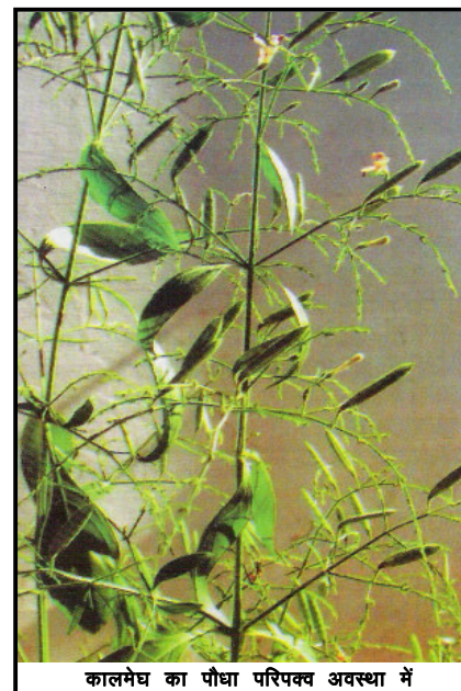
कालमेघ का पौधा परिपक्व अवस्था में

कालमेघ एक से तीन फीट ऊंचा एक वर्षीय पौधा होता है जिसे यदि अनुकूल वातावरण मिले तो यह एक से अधिक वर्ष तक भी चल सकता है। प्रारंभ (छोटी अवस्था) में इसका पौधा बिल्कुल मिर्ची के पौधे जैसा ही दिखता है जिस पर धान के जैसी फलियां लगती हैं। इसकी पत्तियां मिर्ची के पौधे की तरह गहरी हरी, भालाकार,