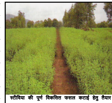
स्टीविया की पूर्ण विकसित फसल कटाई हेतु तैयार

हाल ही के वर्षों में व्यवसायिक एवं औषधीय जगत में अत्यधिक महत्व अर्जित करने वाले पौधे स्टीविया की उपयोगिता इसमें पाए जाने वाले मिठास के गुण के कारण हैं। सामान्य शक्कर से 25 से 30 गुना अधिक मीठा होने के साथ साथ स्टीविया की विशेषता यह भी है कि यह पूर्णतया कैलोरी रहित है जिसकी वजह से मधुमेह के रोगियों के लिए शक्कर के रूप में इसका उपयोग पूर्णतया सुरक्षित है। इसके साथ-साथ ऐसे व्यक्ति जो “कैलोरी कांशियस” हैं तथा जो अपना वजन बढ़ने के प्रति काफी सचेत रहते हैं, उनके लिए भी इसका उपयोग सुरक्षित है। क्योंकि वर्तमान में प्रयुक्त हो रहे विभिन्न उत्पाद मानव मात्र के लिए पूर्णतया सुरक्षित नहीं हैं अतः ऐसे में स्टीविया जोकि एक पूर्णतया हर्बल उत्पाद है तथा सभी प्रकार के दूरगामी प्रभाव से मुक्त है, शक्कर का एक उपयुक्त प्रभावी विकल्प बनता जा रहा है। वर्तमान में विभिन्न पूर्वी देशों जैसे जापान तथा कोरिया आदि में स्वीटनर्स के 40 प्रतिशत मार्केट पर स्टीविया सार का अधिपत्य हो चुका है जिसमें निरन्तर बढ़ोत्तरी हो रही है। भारत जैसे देश में जहाँ मीठे तथा मिठाई का अत्यधिक प्रचलन है तथा मिष्ठान प्रेमी भारतीयों द्वारा जहाँ मीठे के बिना जीवन