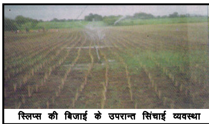
स्लिप की बिजाई के उपरान्त सिंचाई व्यवस्था

अधिकांशतः लेमनग्रास की बिजाई स्लिप से ही की जाती है तथा यही विधि सर्वाधिक उपयोगी, लाभकारी तथा सुविधाजनक भी है। स्लिप से