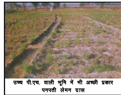
उच्च पी.एच. वाली भूमि में भी अच्छी प्रकार पनपती लेमन ग्रास

स्लिप लेमनग्रास के बीजों अथवा प्लांटिंग मेटेरियल के रूप में प्रयुक्त किए जाते हैं। प्रायः एक एकड़ के क्षेत्र में लगभग 15000 स्लिप की आवश्यकता होती है (एक एकड़ में कितने पौधे स्लिप) लगेंगी