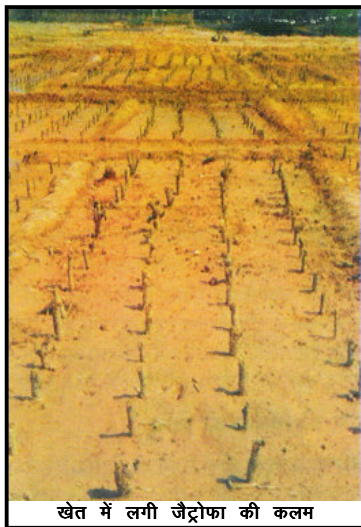
खेत में लगी जैट्रोफा की कलम

जैसा कि उपरोक्तानुसार वर्णित है वर्तमान में जिस प्रमुख उपयोग के