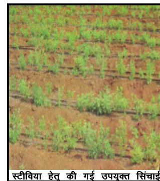
स्टीविया हेतु की गई उपयुक्त सिंचाई

अन्य देशों की अपेक्षा अधिक है। मीठे के सभी उत्पाद अधिक कैलोरी से युक्त होते हैं जिसके फलस्वरूप उपरोक्त बीमारियाँ होती हैं। स्टीविया हर्बल उत्पाद होने के कारण पूर्ण रूपेण सुरक्षित है क्योंकि इसका कोई साइड इफेक्ट नहीं है तथा वर्तमान में भारतीय बाजार में प्रचलित एवं बहुप्रयोगित स्वीटनर्स जैसे सैक्रीन, सुगर फ्री एवं स्पोर्टम की अपेक्षा पूर्णतया सुरक्षित है। भारतीय आंकड़े यह संकेत देते हैं कि इस देश में औसतन 18 प्रतिशत से अधिक लोग मधुमेह एवं इसी के आसपास हाइपरटेन्सन एवं मोटापे से ग्रस्त हैं। इसके अतिरिक्त स्टीविया रक्तचाप एवं रक्तशर्करा का नियमितीकरण करता है। यह पैक्रियाज को इन्डयूस करता है जिससे इन्सुलिन उत्पन्न होता है। इसके प्रयोग से चर्म विकारों से मुक्ति मिलती है। विभिन्न उत्पादों का पलेवर बढ़ाने में इसका प्रयोग होता है यह एन्टी बैक्टीरियल एवं एन्टीवायरल एजेन्ट के रूप में कार्य करता है। इससे दातों एवं मसूड़ों में होने वाली बीमारियों से मुक्ति मिलती है। इसका प्रयोग शक्कर के विकल्प एवं विस्थापन में प्रभावी रूप से किया जा सकता है विशेषतया मधुमेह रोगियों तथा कैलोरी रहित होने के कारण हाइपरटेन्सन एवं मोटापे से युक्त लोगों के लिये भी वरदान है। अब इसका उपयोग धीरे-धीरे चाय, बिस्कुट, काफी, मिठाइयों एवं अन्य मीठे उत्पाद के निर्माण में भी होने लगेगा। स्टीविया के एक एकड़ फसल में उतनी ही चीनी प्राप्त होती है जो 36 एकड़ गन्ने से प्राप्त होती है इस प्रकार यह फसल गन्ने की चीनी के सर्वोत्तम विकल्प के रूप में उभरी है।