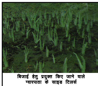
विजाई हेतु प्रयुक्त किए जाने वाले ग्वारपाठा के साइड टिलर्स

औषधीय एवं व्यवसायिक दृष्टि से ज्यादा महत्वपूर्ण हैं, वे हैं— एलो बारबेडन्सिस मिल अथवा एलो वेरा टोर्न एक्स लिन्न जिससे कुराकाओं अथवा भारतीय अथवा बार्बेडोज़ एलो मिलता है; एलो फेरोक्स मिलर