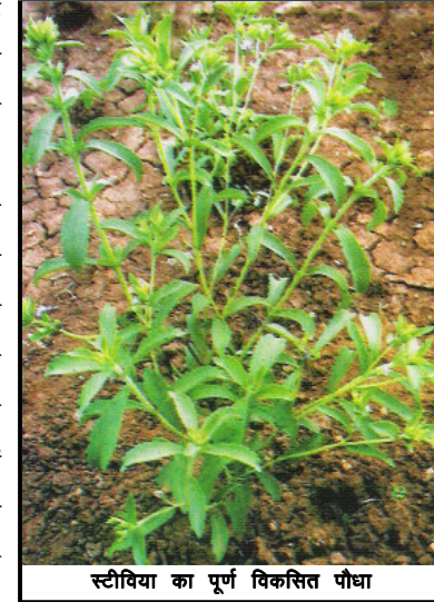
स्टीविया का पूर्ण विकसित पौधा

रोगियों की संख्या 5.7 करोड़ तक पहुंच गई है। इस वस्तुस्थिति के फलस्वरूप विभिन्न न्यून कैलोरी स्वीटनर्स जैसे शुगर फ्री, ईकुअल, टोटल आदि हमारे भोजन का आवश्यक अंग बन चुके हैं। दुर्भाग्यवश इन उत्पादों के पूर्णतया सुरक्षित न होने के कारण डॉक्टर तथा वैज्ञानिक किसी ऐसे उत्पाद की खोज में थे जो न्यून कैलोरी तथा शुगर फ्री होने के साथ-साथ प्राकृतिक स्रोत से भी प्राप्त किया गया