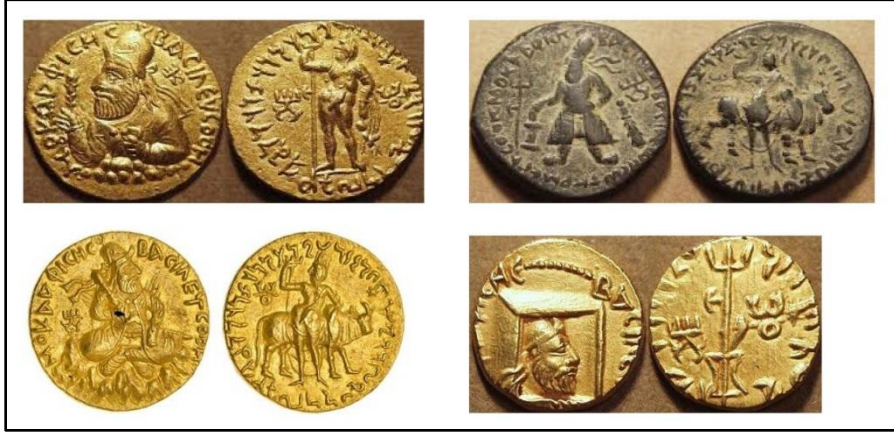
विम कदफिस के सिक्के

अन्तर्राष्ट्रीय क्षेत्र के लिए निर्मित किए गए, किन्तु ताँबे के सिक्के तो समाज के दैनिक जीवन के लिए थे। सम्भव है, इसी को ध्यान में रखकर वीम ने महान् उपाधि “महाराजाधिराज त्रातारस” को ताँबे की मुद्राओं पर स्थान दिया जिसे कनिष्क ने भी अपनाया।