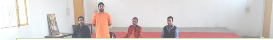
दीप प्रज्वलन कर योग प्रशिक्षण शिविर का उद्घाटन करते हुए माननीय अतिथि एवं उपस्थित छात्रा-छात्रायें।