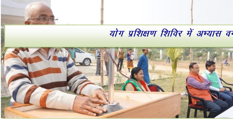
योग प्रशिक्षण शिविर में अभ्यास वग