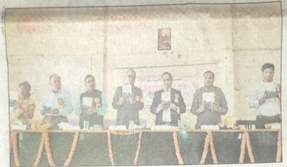
शनिवार को पीपीगंज के बापू स्नाकोत्तर महाविद्यालय में दो दिवसीय राष्ट्रीय संगोष्ठी के आयोजन के दौरान मंच पर मौजूद मुख्य अतिथि व वक्तागण।