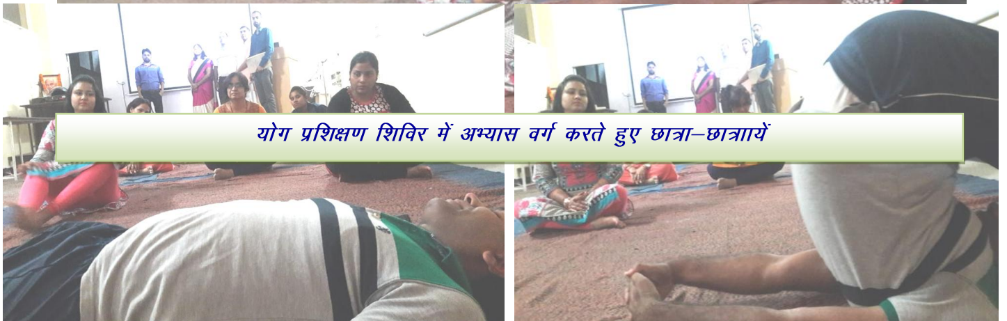
योग प्रशिक्षण शिविर में अभ्यास वर्ग करते हुए छात्रा-छात्राएँ