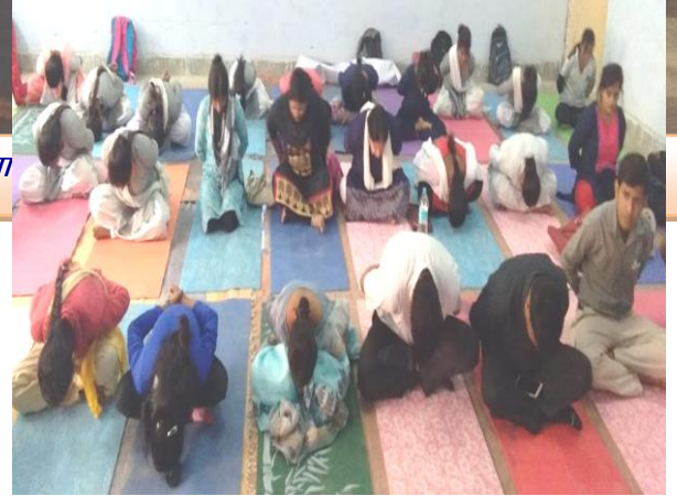
योग प्रशिक्षण शिविर में अभ्यास वर्ग करते हुए महाविद्या