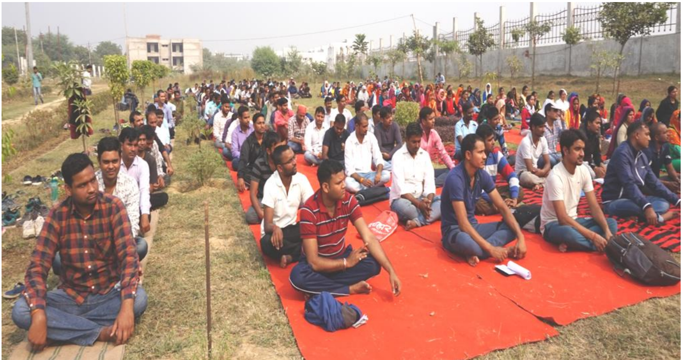
योग प्रशिक्षण शिविर में उपस्थित छात्रा-छात्रायें

उ0प्र0 राजर्षि टण्डन मुक्त विश्वविद्यालय ने अपने पाठ्यक्रम में व्यावहारिक आयाम देने के लिए प्रदेश स्तर पर योग अभ्यास वर्ग एवं उसके साथ एक बौद्धिक सत्रा चलाने का अभियान अपनाया है।