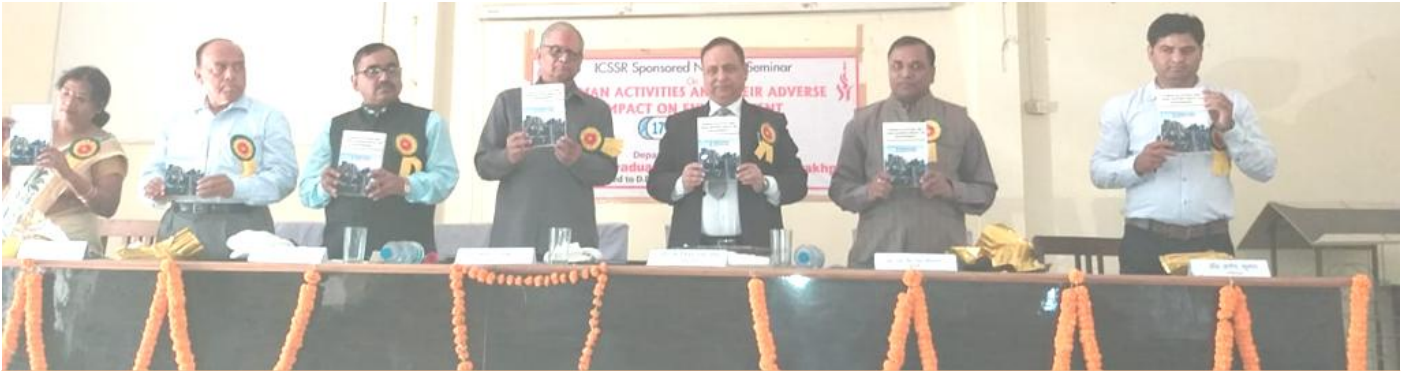
पीपीगंज के बापू स्नातकोत्तर महाविद्यालय में दो दिवसीय राष्ट्रीय विचार गोष्ठी के आयोजन के दौरान पुस्तक का विमोचन करते हुए मुख्य अतिथि