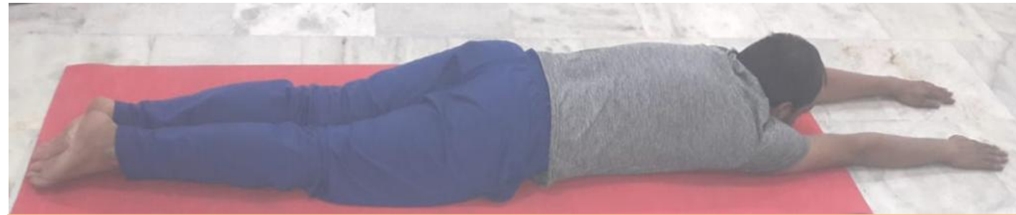
विश्वविद्यालय के अध्ययन केन्द्र भारतीय शिक्षा शोध संस्थान, सरस्वती कुंज, निराला नगर, लखनऊ के परिसर में योग प्रशिक्षण शिविर में अभ्यास वर्ग करते हुए छात्रा-छात्रायें