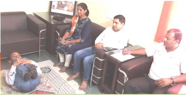
योग प्रशिक्षण शिविर में अभ्यास वर्ग करते हुए छात्रा-छात्रायें