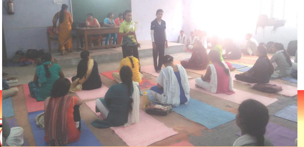
योग प्रशिक्षण शिविर में अभ्यास वर्ग करते हुए छात्रा-छात्रायें