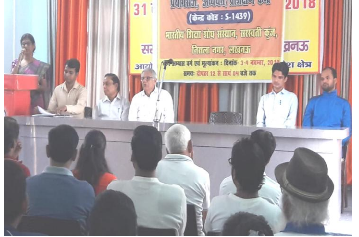
कार्यक्रम में अपने-अपने विचार व्यक्त करते हुए अतिथि

प्रयागराज, संध्यपन/प्रास्ताविक, सरस्वती कुंज, विद्याला नगर, लखनऊ में योग प्रशिक्षण शिविर में अभ्यास वर्ग करते हुए छात्रा-छात्रायें