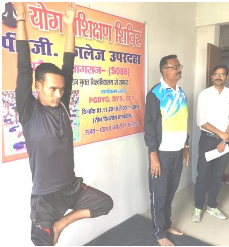
योग प्रशिक्षण शिविर