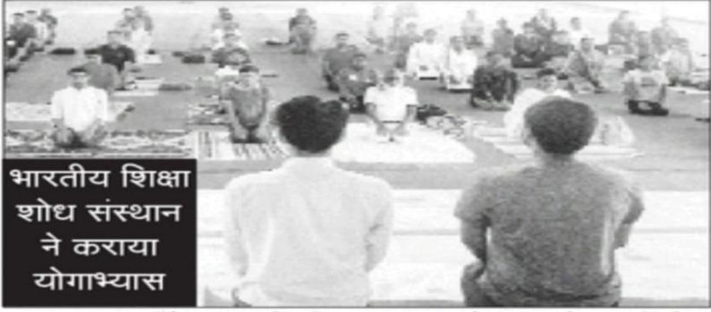
भारतीय शिक्षा शोध संस्थान ने कराया योगाभ्यास