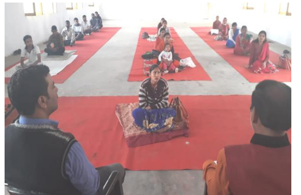
योग प्रशिक्षण शिविर में अभ्यास वर्ग करते हुए छात्रा-छात्रायें