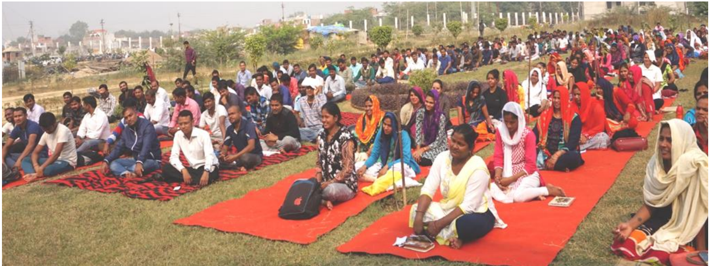
योग प्रशिक्षण शिविर में उपस्थित छात्रा-छात्रायें